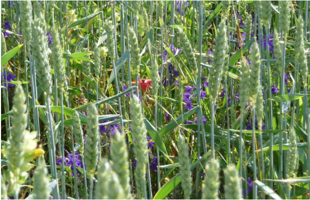
Ackerwildkräuter im Weizenfeld