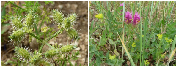
Früchte der Acker-Haftdold sowie Ackerwachtelweizen und Rundblättriges Hasenohr

Die Tagung wird organisiert durch das Landratsamt Calw in Kooperation mit der Universität Hohenheim und der Stadt Nagold mit freundlicher Unterstützung der Sparkasse Pforzheim Calw.